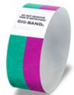
スタッフ ボランティア