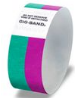
スタッフ ボランティア