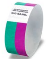
スタッフ ボランティア