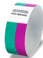
スタッフ ボランティア